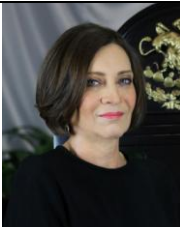
DIP. SUSANA HERNÁNDEZ FLORES VOCAL PARTIDO REVOLUCIONARIO INSTITUCIONAL